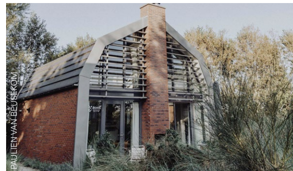
PAULIEN VAN BEUSEKOM

Hier smokkelen we een beetje, want dit is geen huisje maar een hotel. Strandhotel Zoomers heeft stijlvolle hotelkamers, suites en een familieappartement met uitzicht op de Castricumse duinen en het strand. Alle ingericht door en met HKLiving, ofwel: met het interieur zit wel snor. In elke kamer vind je een designkitchenette, biologisch eten kan in het restaurant. ZOOMERSAANZEE.NL