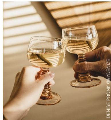
DENISE PRONK @BYDENIZE